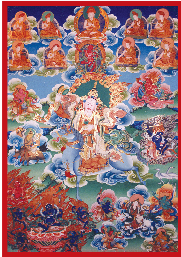
阿企佛母 Achi Chokyi Drolma